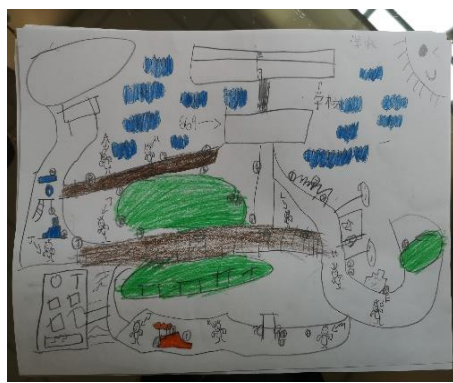
幼儿说：“这个是我们的学校，这边是那个游乐场。、我们有两个游乐场在这边。”