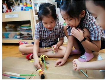
幼儿讨论如何让“树”立起来。