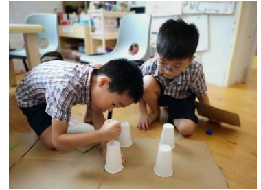
幼儿尝试用纸杯制作柱子。