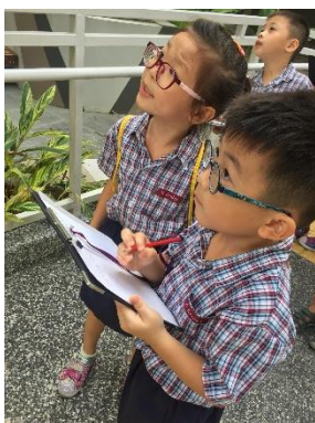
幼儿记录小区不同的标志。