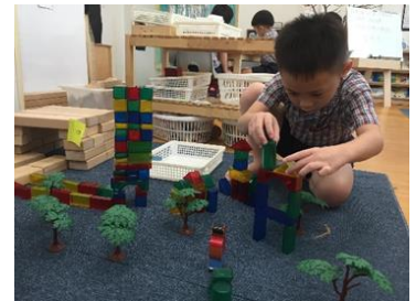
幼儿在建构空间进行搭建活动。